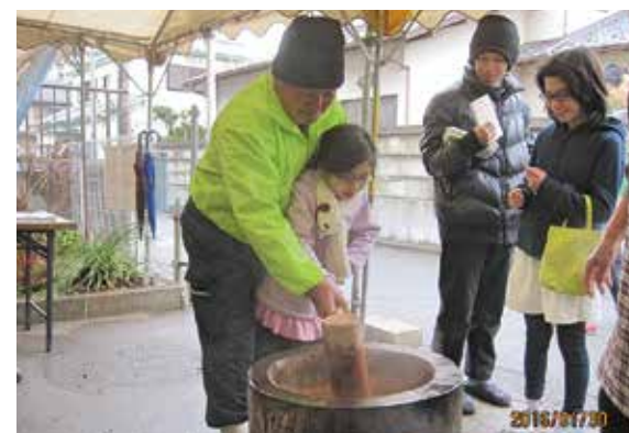
▲親子イベント餅つき大会