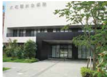
▲北口エントランス