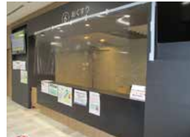
▲おくすりカウンター