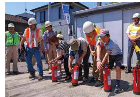
▲自治会前にて消火訓練